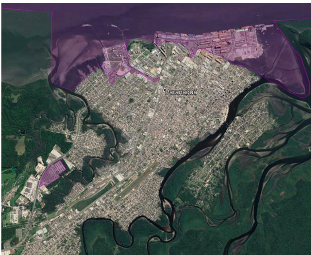
Figura 1 – Área de realização dos serviços em Paranaguá

Independentemente dos locais acima listados os serviços também poderão ser executados em outras áreas de responsabilidade da APPA, desde que solicitados pela Fiscalização-APPA.