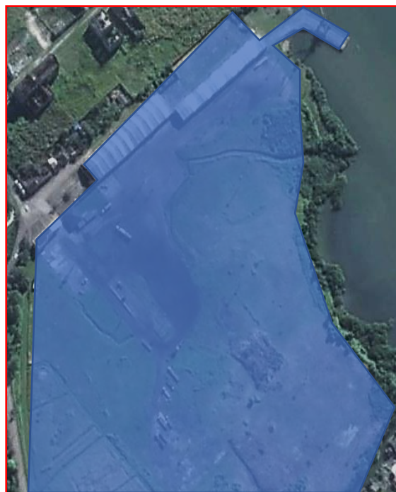
Figura 2 – Porto Barão de Teffé (Antonina)